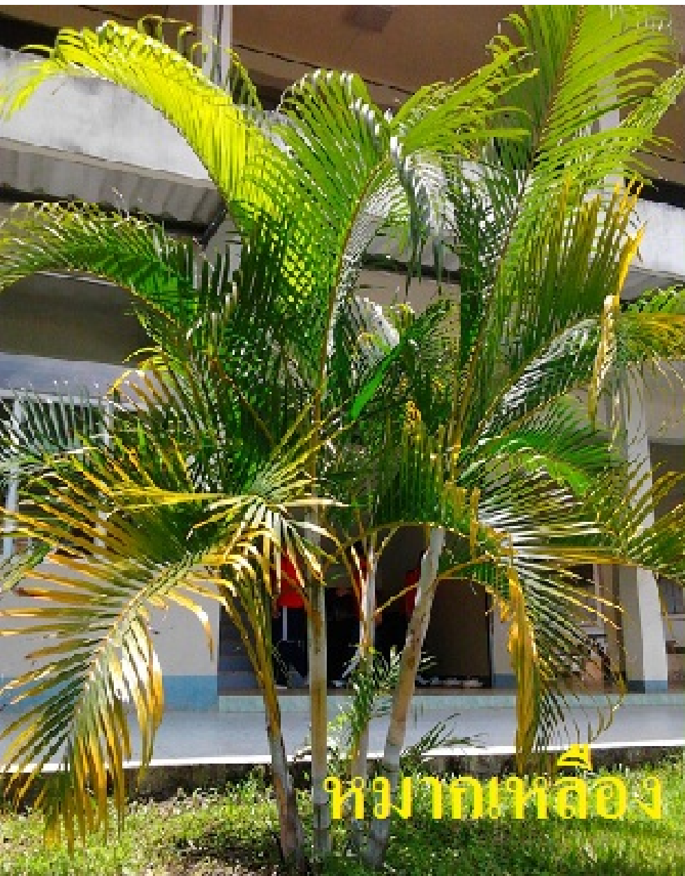
หมากเหลือง