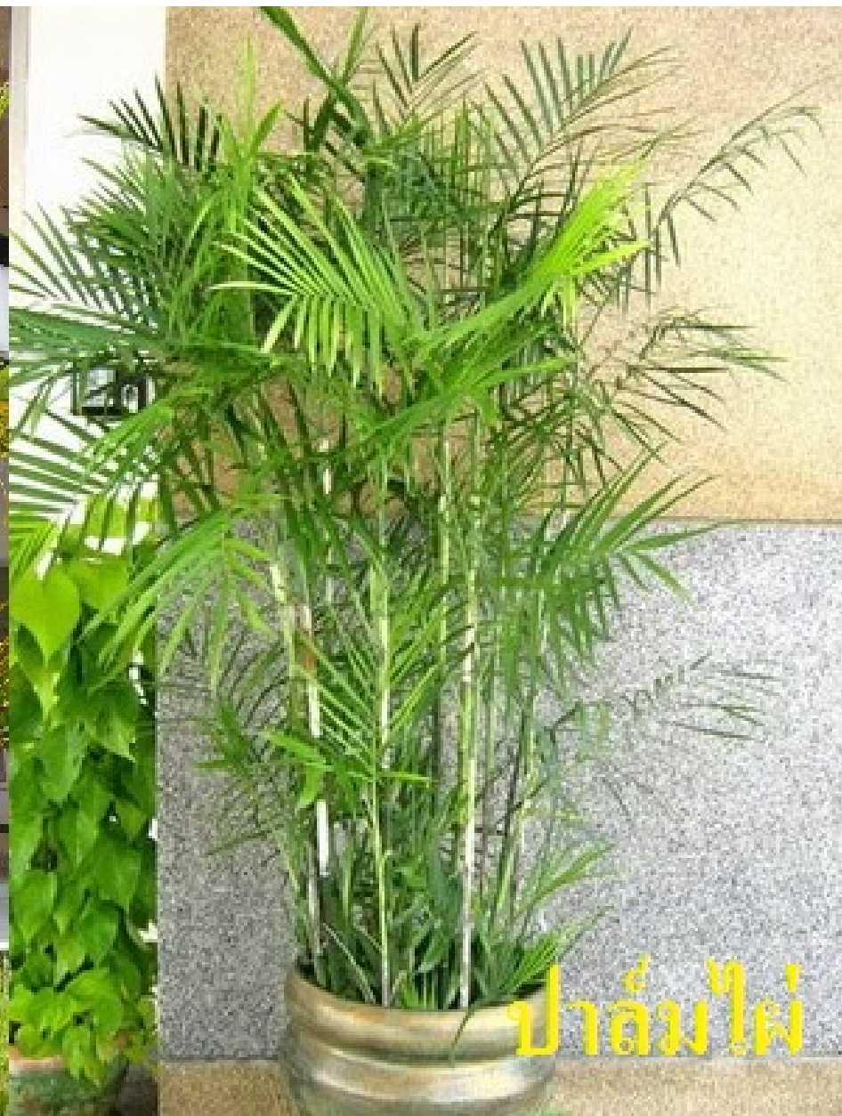
ปาล์มไผ่